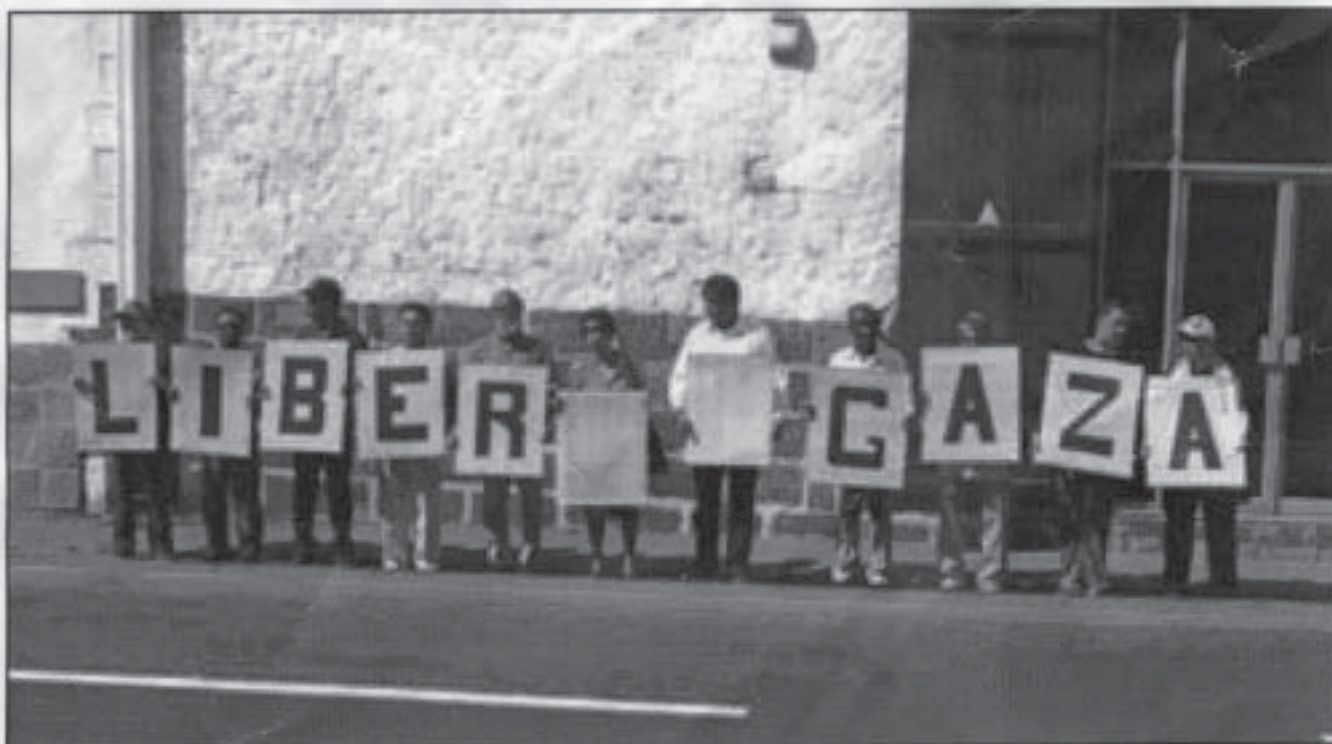
Manif omanize nar LALIT ou proteste kont Atak Israel lor "flotila laliberte": divan Lanbasad US, Port-Louis, 3 Zin 2010